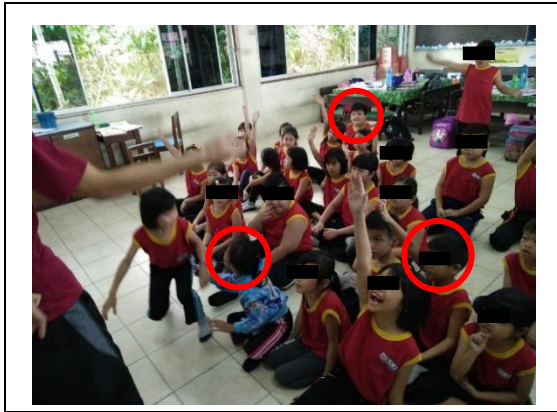
Rajah 2. Ketiga-tiga peserta kajian (bulatan merah) bersifat aktif dan sanggup memberi kerjasama kepada guru