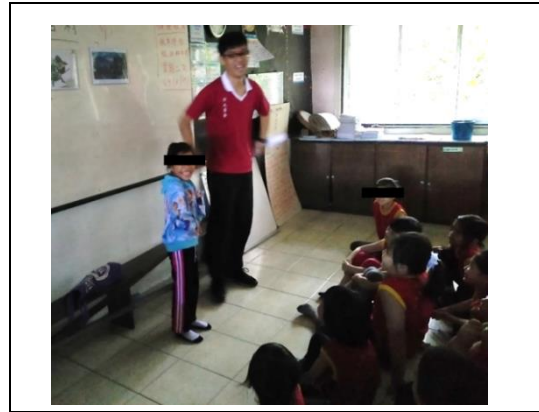
Rajah 3. Murid C berlakon perwatakan cerita secara sukarela